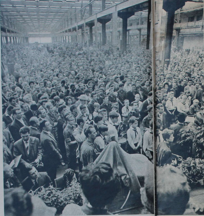
„Als ich so alt war“, sagte Chruschtschow zu dem 15jährigen Lehrling, „lernte ich Schlosser.“