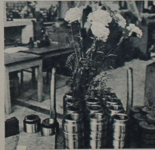
Blommor till Nikita och ett löfte att nå högsta produktionsresultat. Ty fabriken exporterar till många av världens länder.