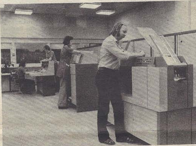
So arbeiten die Kolleginnen und Kollegen an der Rechentchnik

Doch auch durch diese Maßnahmen reichten die Rechnerzeiten noch nicht aus. Deshalb erklärten sich die Mitglieder des sozialistischen Kollektivs „20. Jahrestag der DDR“, welches bereits achtmal mit dem Staatstitel ausgezeichnet wurde, auch häufig bereit,